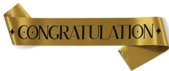
客製化小物(示意圖)