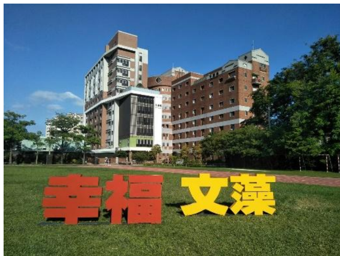
幸福、文藻鐵殼字(操場)