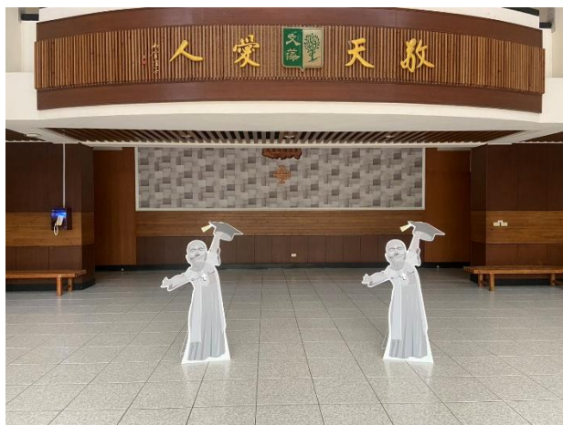
典禮會場佈置(示意圖)