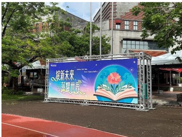
典禮主題帆布(升旗台前)