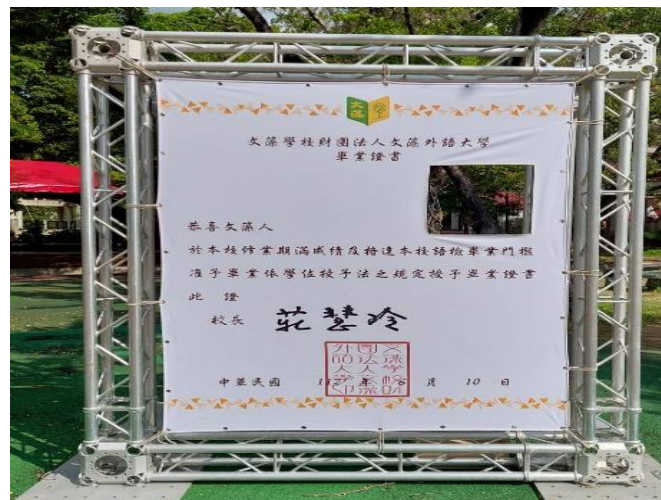
畢業證書合影牆(操場)