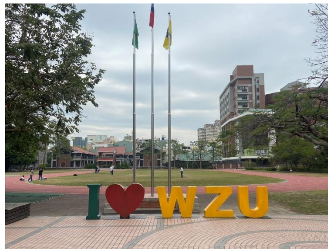
我愛文藻鐵殼字(紅磚道)