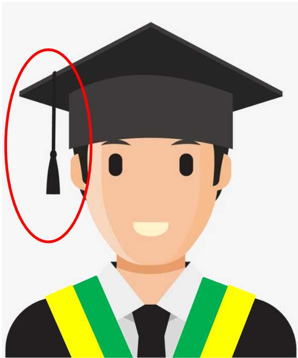
未撥穗 (帽穗位於畢業生右手側)